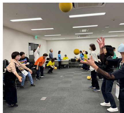
フラバールで対戦